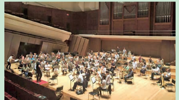
合同演奏に向けた大ホールでのリハーサルの様子

糸1-2-3) 【定員】 ▶小ホール=各プログラム先着252人 【入場料】 無料 【申込み】 ▶大ホール=当日直接会場へ▶小ホール=事前に、トリフォニーホールチケットセンターへ