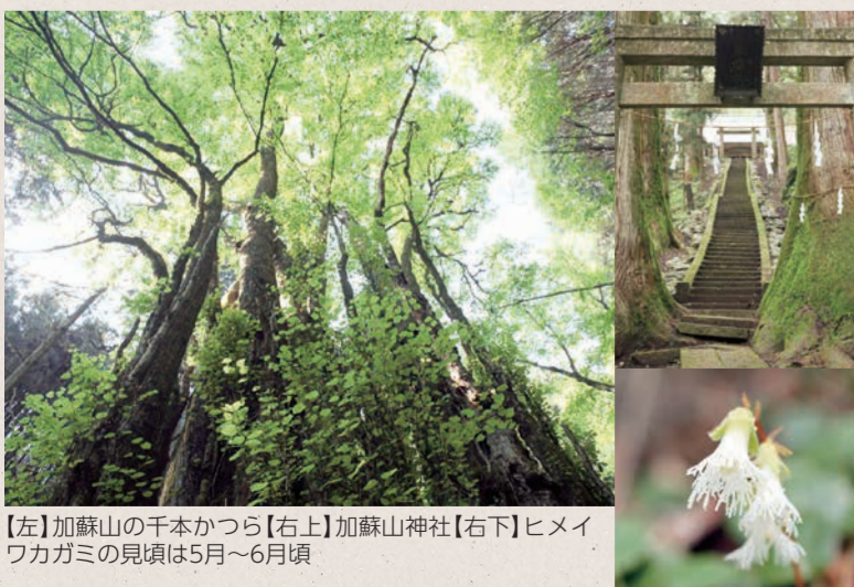
【左】加蘇山の千本かつら【右上】加蘇山神社【右下】ヒメイワカガミの見頃は5月～6月頃

標高1000m前後の低山が連なり、足尾、栗野の山々や関東平野が一望できます。全行程約6km、はしごや約20mのくさり場が4か所、急斜面の崖もある、冒険とロマンのコースです。転落事故が起きているので、登山の際は、装備・服装をしっかりと整え、十分に注意してください。 【アクセス】▶バス=バス停「石裂山」下車(リーバス 上久我線/1日2本/東武日光線新鹿沼駅から約45分) ▶車=鹿沼ICから約40分