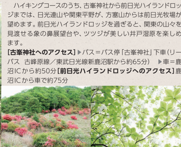
【左】コースの見所の一つである、深山巴の宿【中央】古峰ヶ原高原【右】シロヤシオ(ゴヨウツツジ)の見頃は5月下旬～6月上旬頃

ハイキングコースのうち、古峰神社から前日光ハイランドロッジまでは、日光連山や関東平野が、方塞山からは前日光牧場が望めます。前日光ハイランドロッジを過ぎると、関東の山々を見渡せる象の鼻展望台や、ツツジが美しい井戸湿原を楽しめます。