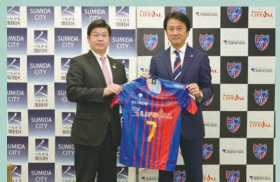
FC東京バレーボールチームと連携協定を締結。すみだに新たなホームタウンスポーツチームが誕生しました。

うらかな春の日差しを感じる季節、区内ではスポーツ・運動に関する催しを数多く行っていますので、ぜひご参加いただき、健康増進にお役立てください。