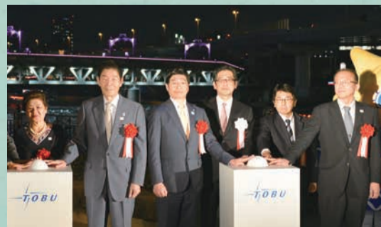
東武スカイツリーライン隅田川橋梁ライトアップ点灯式に参加。美しいライトアップを皆さんもご覧ください。

4月5日、本区の人口が27万人を突破しました。今後も多くの方から選ばれ「暮らし続けたい」と思っただけのまち、子どもたちの元気な声が弾む、笑顔があふれるまちをめざしていきます。