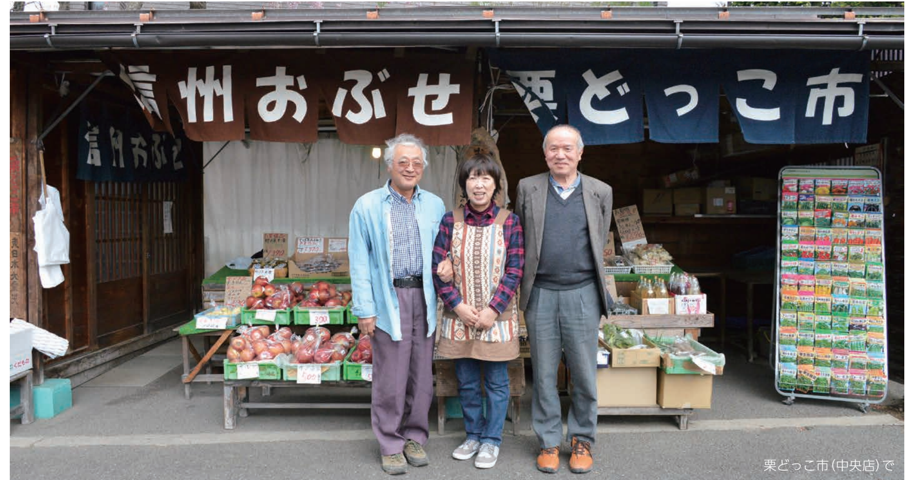
栗どっこ市(中央店)で