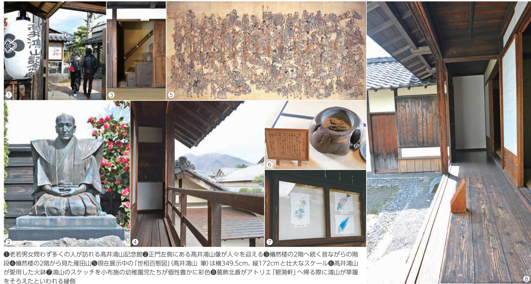
①老若男女問わず多くの人を訪れる高井鴻山記念館②正門左側にある高井鴻山像が人々を迎える③儼然楼の2階へ続く昔ながらの階段④儼然楼の2階から見た雁田山⑤現在展示中の「世相百態図」(高井鴻山 筆)は横349.5cm、縦172cmと壮大なスケール⑥高井鴻山が愛用した火鉢⑦鴻山のスケッチを小布施の幼稚園児たちが個性豊かな彩色⑧葛飾北斎がアトリエ「碧漪軒」へ帰る際に鴻山が草履をそろえたといわれる縁側