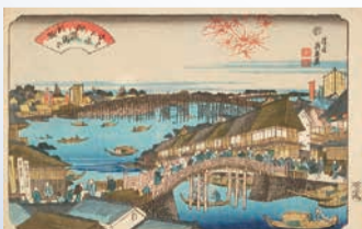
江戸八景両国橋の夕照 (1843年～1847年)