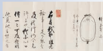
南蛮流火術花火伝書 (1804年～1818年)