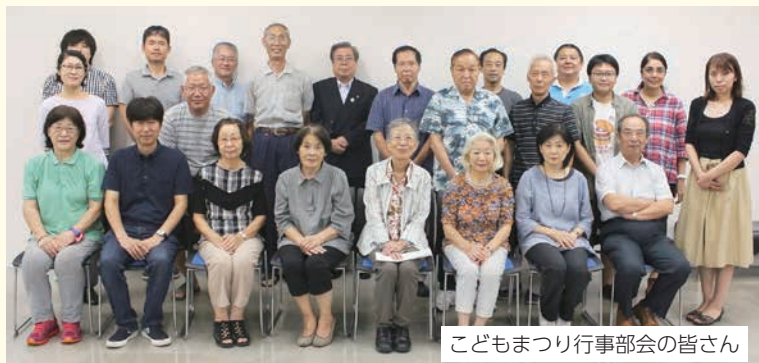
こどもまつり行事部会の皆さん

こどもまつりの主役は子どもたちです。私たち「こどもまつり行事部会」では、主役である子どもたちの笑顔であふれる舞台を整えるため、入念に準備してきました。すみだまつり・こどもまつりの会場では、模擬店や物産展、ステージショーなど色々な催しが行われますが、それらに負けない楽しい企画をたくさん用意しました。皆さんの笑顔に会えるのが楽しみです。ぜひ、遊びに来てくださいね!