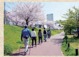
▲ノルディックウォーキング

もともとスポーツに関係する仕事をしていたこともあり、スポーツを通してすみだに恩返しをしたいという思いを抱いていました。そんな中、「墨田区が総合型地域スポーツクラブの支援を始めるみたいだから、もし興味があったら」と、知人から誘いがあったんです。そこで、まずスポーツ推進委員になり、その後スポーツドアあずまの立ち上げに参画しました。