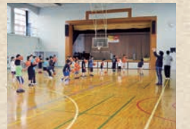
▼子ども向けミニバスケットボール