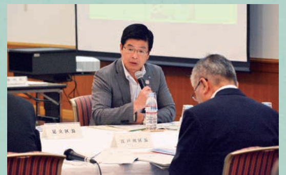
墨田区・江東区・足立区・葛飾区・江戸川区が一体となって大規模水害への対応策を検討しています。

バスのスカイツリーシャトル上野・浅草線が自由に乗り降りでき、墨田・台東区内の美術館・博物館、協力店舗等で割引や特典が受けられます。ぜひ、ご活用ください。