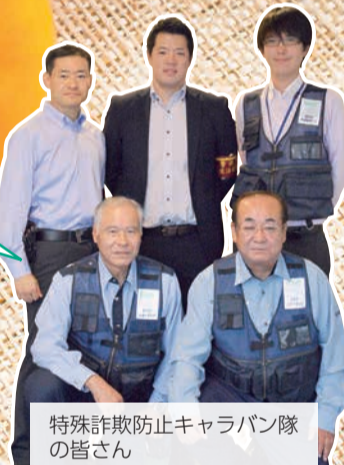
特殊詐欺防止キャラバン隊の皆さん