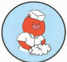
墨田区食品衛生キャラクター「すみだこ」

▶肉や魚は、他の食品と接触しないよう、袋に入れるなどしてから冷蔵庫で保存する ▶調理前後は、石けんでしっかりと手洗いを ▶下ごしらえでは、肉や魚を最後に処理する ▶使った調理器具はすぐに洗剤でよく洗う