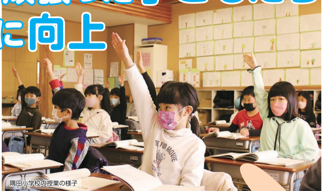
隅田小学校の授業の様子