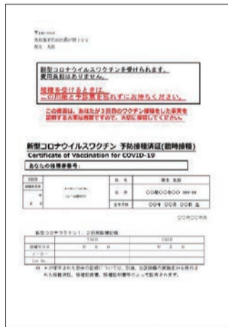
▲接種時に受け渡す接種済証

ワクチン接種日の時点で墨田区に住民登録があり、接種証明書の交付を希望する方 *国内で接種を証明する場合は、接種時に受け渡す接種済証または接種記録書でも証明可