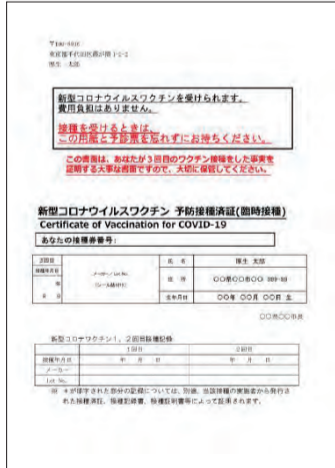
▲接種時に受け渡す接種済証

対象 ワクチン接種日の時点で墨田区に住民票があり、接種証明書の交付を希望する方 *国内で接種を証明する場合は、接種時に受け渡す接種済証または接種記録書でも証明可