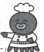
墨田区食品衛生キャラクター「すみだこ」