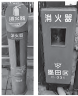
【写真左】主要道路配備消火器 【写真右】地域配備消火器

【点検期間】 4月中旬～10月末 【問合せ】 防災課防災係 ☎5608-6206