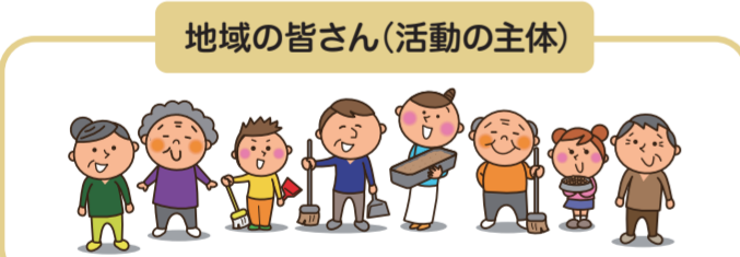
地域の皆さん(活動の主体)