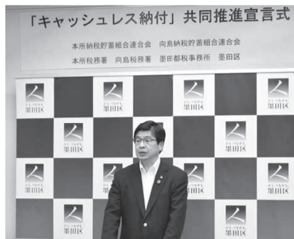
5年6月「すみだキャッシュレス納付共同推進宣言式」の様子 *区と各税務関係機関ではキャッシュレス納付を推進中

申告手続は、インターネットや郵送が便利です。ご不明な点は、最寄りの各税務関係機関へお気軽にお問い合わせください(4面の「税についての問合せ先」を参照)。