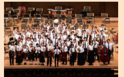
トリフォニーホール・ジュニア・オーケストラ