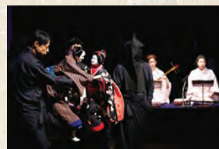
明暮れ小唄 「北斎小唄 其の参 両国心中」

【対象】 9月1日~12月22日に区内各所および隅田川流域で個人または団体が実施する企画 【申込み】 応募用紙を郵送またはEメールで4月15日(消印有効)までに、「隅田川 森羅万象 墨に夢」実行委員会事務局(〒130-0013錦糸1-2-3・墨田区文化振興財団内) ☎5608-5446・✉sumiyume@sumida-bunka.jpへ *募集要項・応募用紙は「隅田川 森羅万象 墨に夢」のホームページから出力 *電話での問い合わせは月曜日~金曜日の午前9時半~午後4時