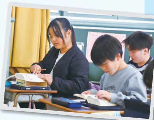
【撮影協力】言問小学校

【対象】 18歳以上の方 【申込み】 随時、すみだ教育研究所(区役所11階) ☎5608-6621へ