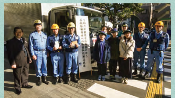
「輪島市への救援物資搬送派遣の出発式」にて、第一寺島小学校の児童・東京都トラック協会墨田支部等の皆さんと

皆さんの温かい心を、しっかりとお届けします。被災地の日常生活の再建が少しでも早く進むことを心から願い、今後も積極的な支援を続けていきます。