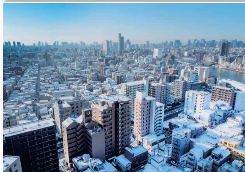
「雪化粧の朝」