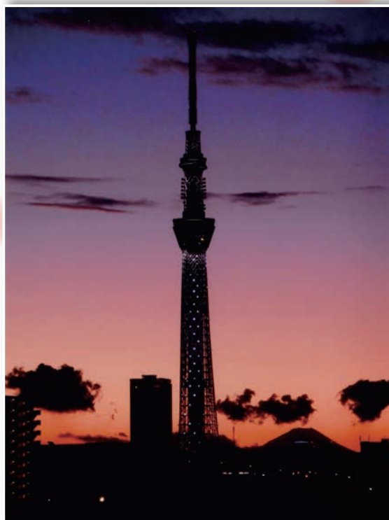
「元日の夕暮れ」