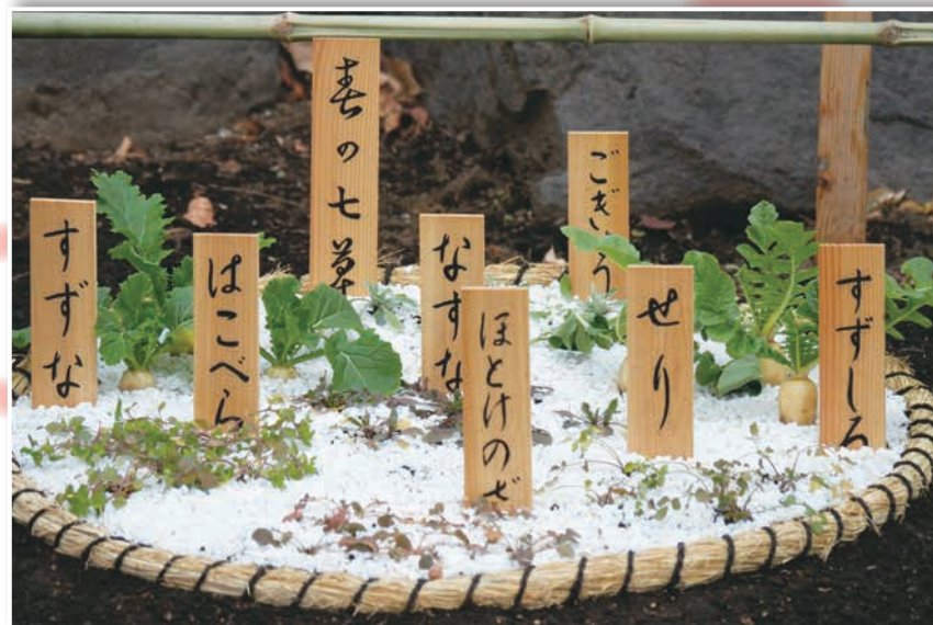
「春の七草」

「すみだ三十六景」は春から新コーナーにリニューアルします！ 2年間ありがとうございました *新コーナーの詳細は、4月以降に本紙 等でお知らせします。