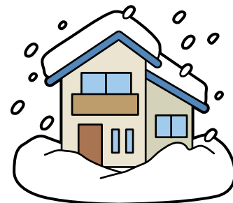
「大雪特別警報」が発令されたとき