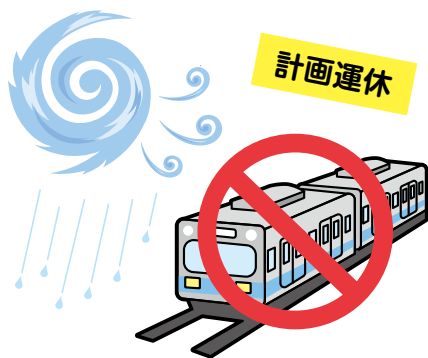
主要交通機関の計画運休の 発表があったとき