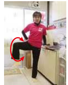
股関節のほぐし(膝を伸ばして・膝を曲げて・内回し外回し)