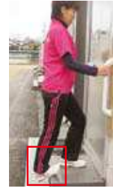
アキレス腱伸ばし