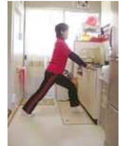
ふくらはぎ伸ばし