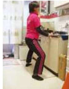
ハーフスクワット