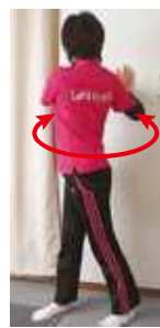
上体ひねり(左右・斜め上)