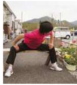
内ももと背中伸ばし