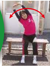
背伸び・体側伸ばし