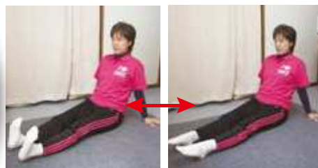
足首の曲げ伸ばし

じっとしていると足腰の血が悪くなり、疲労や腰痛、むくみや冷えにつながります。意識して脚の血流改善を積極的に行いましょう!