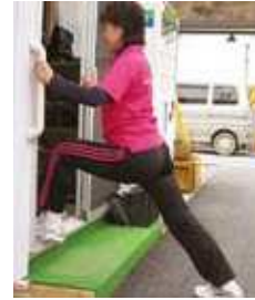
股関節とふくらはぎ