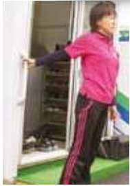
玄関の手すりを使って肩のストレッチ