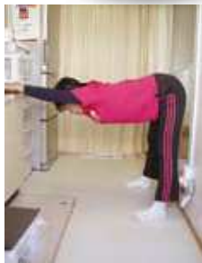
肩と太もも裏のばし