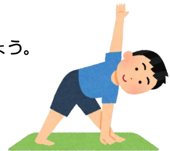
イラスト：いらすとや

相談事例では、消費者センターで契約書を確認したところ、2年間の契約であること、契約中の解約は2万円の解約料が必要であること、契約変更や解約手続きは店舗で行うことが明記されていました。解約の方法、条件等については契約書の記載に従うことになることと説明し、自主交渉するよう助言しました。