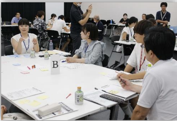
【タウンミーティングの様子】