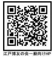
江戸博友の会一般向けHP