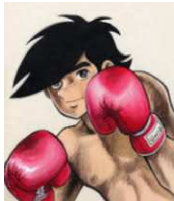
「あしたのジョー」は連載開始から50周年！ ©高森朝雄・ちばてつや/講談社