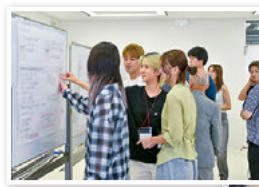
「ツナむすび委員会」で の活動の様子 「みんなでつくろう！ミ ライのすみだ」墨田区基 本計画ワークショップ