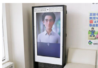
対話AIキャラクターシステム モニターに向かって話すと キャラクターと会話ができる

キャラクターシステムを導入しました。こちらは、AIのキャラクターと話しながら、会員登録の方法や自分に合った仕事を知ることができます。