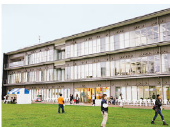
墨田キャンパスの様子