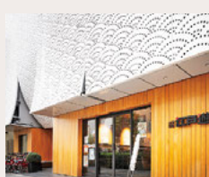
はじまり エピソード

当時と比べると、今は社会も個人の考えも、変わってきていると感じます。行政の支援や制度も整ってきています。これからの時代、性別に関係なく、自分の思いを持って一歩踏み出す人がもっと増えてほしい。そんな未来を、心から願っています。