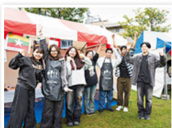
iUFes2025での ミャンマー留学生で 出したブース