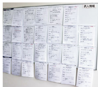
求人情報の掲示板