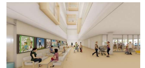
「区民ラウンジとエントランス」イメージ

バリアフリーやユニバーサルデザインに基づいた整備計画等により、親子連れや高齢者、障害のある方でも利用しやすい施設運用を目指し、調整を進めている。また、多くの人の目に触れるエントランスにおいては、温かみのあるしつらえと明るい吹抜け等により、区民が立ち寄りやすい雰囲気醸成するとともに、デジタルサイネージの活用により、利用者が迷わずに目的の場所にたどり着ける施設案内と、健康づくりや子育て、教育など様々な役立つ情報の効果的な発信を実現する。