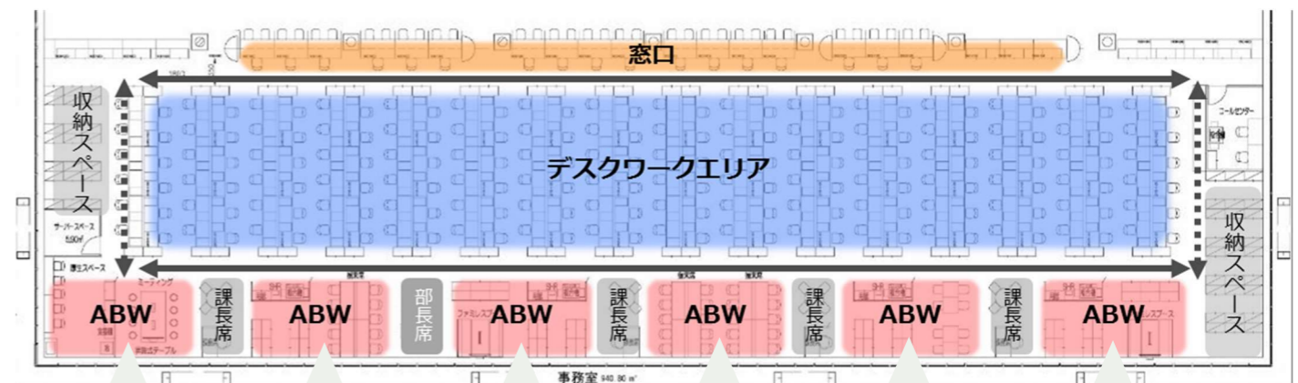
新施設 2 階保健所執務室エリアのレイアウトイメージ

その実現に向けて、今年度は新施設に移転予定部署の職員に対し、視察やワークショップ等を実施し、新しい働き方の意識醸成を行った。また執務室や諸室についてのヒアリングも行い、オフィスユーザーとしての意見も聴取した。今後はそれに基づいて、窓口対応、デスクワーク及び様々なミーティングに適した家具什器を選定し、デジタルツールの活用や紙文書削減等ペーパーレス化を促進することとも併せ、職員の生産性を向上させることにより、これまで以上に様々な課題に機敏に取り組めるようにし、より一層の区民サービスの向上を目指していく。