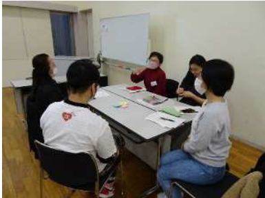
グループ内での検討の様子

「食で人と人をつなぐ」ことをコンセプトに寸劇形式で発表した。発表では、各人がオンラインの会議を通して情報交換をしながらつながることで、それぞれの地域に必要な企画やアイデアが生まれていく様子を表現。