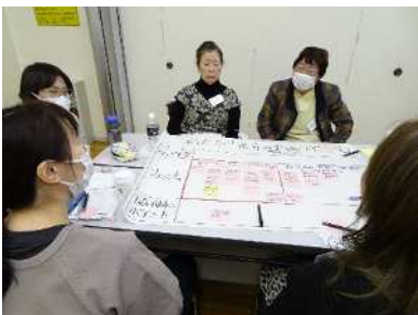
グループ内での検討の様子

すみだ食育推進リーダーにテレビ取材のリポーターがインタビューを行うという設定で発表を行った。リーダーが一人ずつ自分のやりたいことや夢を語り、リポーターがそれをまとめていくことで、最終的には墨田区役所の中に多様な人が集う食堂をつくり、そこを拠点に多様な人の夢を実現していく、という全員の夢がカタチになっていく過程を表現。