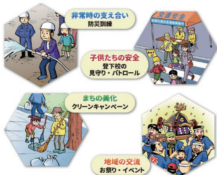
墨田区町会・自治会連合会／墨田区作成リーフレットより抜粋