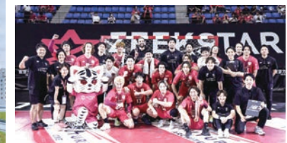
ジークスター東京（ハンドボール）

墨田区には、私たちの誇りになるよう頑張っているホームタウン・スポーツチームがあります。ぜひ、ホームゲームの会場に足を運んで、一緒に応援しませんか？