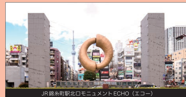
JR 錦糸町駅北口モニュメントECHO（エコー）

大規模ショッピングモールや映画館など、充実した娯楽施設が集まる、墨田区で随一の繁華街。新日本フィルハーモニー交響楽団の活動拠点である、すみだトリフォニーホールでは、オーケストラの鑑賞を臨場感あふれる空間で楽しめます。