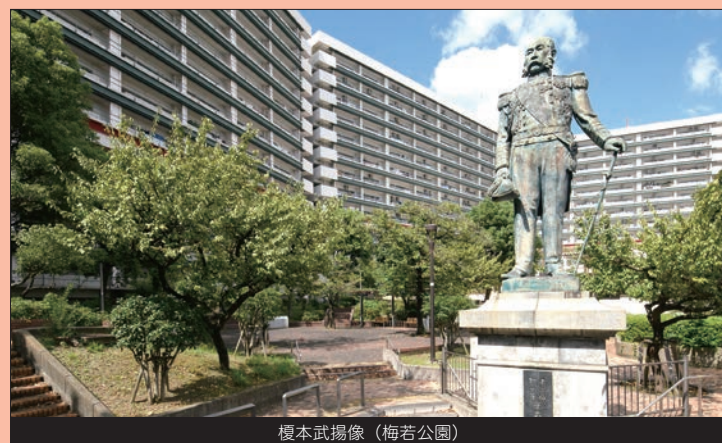
榎本武揚像（梅若公園）

入り組んだ路地が下町らしい鐘ヶ淵と、料亭や老舗和菓子店が点在する向島。ノスタルジックな街並みが魅力のまちです。江戸時代に造園された向島百花園のほか、東白鬚公園や、榎本武揚の像がある梅若公園もあるエリアです。