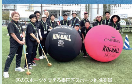
区のスポーツを支える墨田区スポーツ推進委員

墨田区では、みんながスポーツを楽しみ、 スポーツでつながるまちづくりを進めています。 あなたにぴったりの“マイスポーツ”を見つけて、 すみだで楽しいスポーツライフを送ってみませんか。