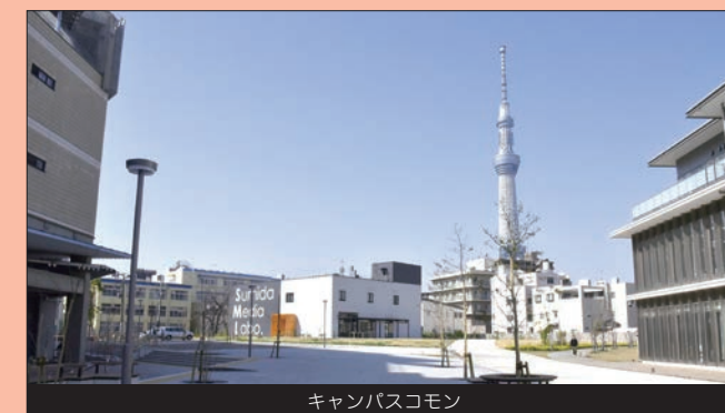
キャンパスコモン

下町情緒を感じさせる路地裏には製造業などを営む工場も多く、商店街と併せて昔懐かしい雰囲気が魅力的です。近年は、IU 情報経営イノベーション専門職大学と千葉大学墨田サテライトキャンパスが開校し、キャンパスコモンでは地域の交流が生まれるなど、さらなる活性化が期待されるエリアです。