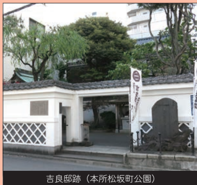
吉良邸跡（本所松坂町公園）

大相撲が開催される両国国技館のある相撲の聖地。周囲には相撲部屋やちゃんこの名店など、相撲ゆかりのスポットのほか、すみだ北斎美術館や東京都江戸東京博物館など、文化芸術の魅力が集まるまちです。また、「忠臣蔵」で有名な吉良邸跡（本所松坂町公園）があるなど、歴史的な史跡が多く残るエリアでもあります。