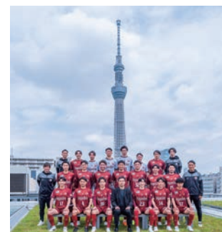
フウガドールすみだ（フットサル）

墨田区には、私たちの誇りになるよう頑張っているホームタウン・スポーツチームがあります。ぜひ、ホームゲームの会場に足を運んで、一緒に応援しませんか？