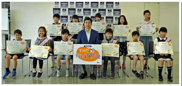
令和3年度の任命式（5月29日）

子どもの感性・視点を通して、区の魅力を発信してもらうことで、シビックプライド醸成を図り、地域の発展に関わろうとする区民を増やすため、毎年任命している「すみだ子どもPR大使」。活動を通して、自身の地域への愛着をさらに深めてもらうことがねらいです。