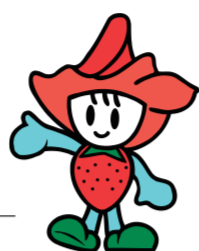
鹿沼市シンボルキャラクター ベリーちゃん