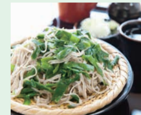
鹿沼名物の「いらそば」もここで食べられます。