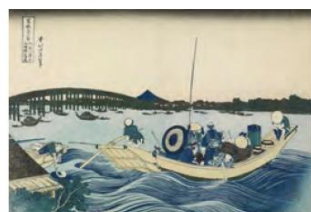
富嶽三十六景「御厩川岸より両国橋夕陽見」 ※本投票済証のイメージは、現在の東京都墨田区出身の浮世絵師、葛飾北斎の作品（すみだ北斎美術館蔵）を利用しています。