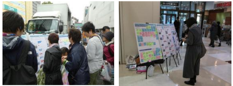
会場の様子（左：すみだまつり、右：イトーヨーカドー曳舟店）