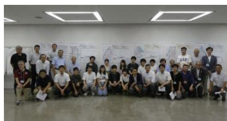
会場の様子 左：全体意見交換 右：参加者集合写真