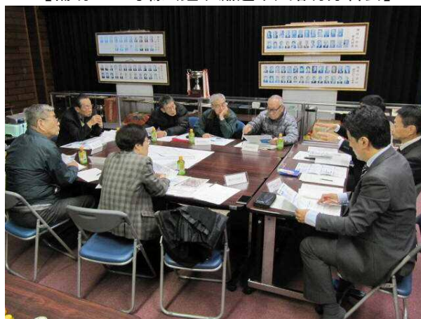
【補助 120 号線（鐘ヶ淵通り）踏切分科会】