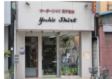
ショーウィンドウを設けた事例