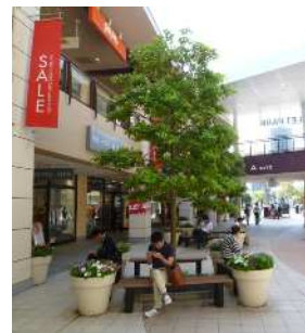
ポケット広場（ ）にベンチを設置した事例