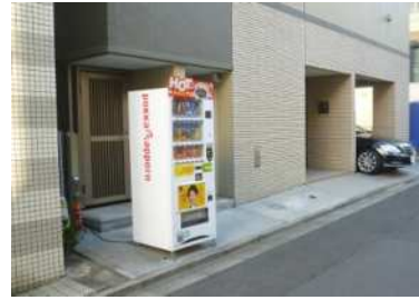
壁面後退部分に自動販売機が設置されている事例