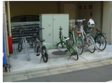
壁面後退部分に固定式自転車ラックが設置されている事例