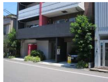
壁面後退部分の緑化の事例