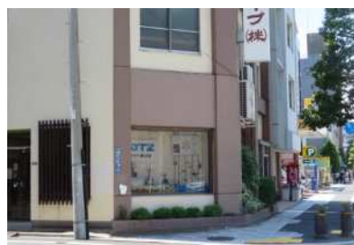
ショーウィンドウを設けた事例

屋内外の活動が相互に望め、賑わいを創出するような形態意匠とする（ショーウィンドウなど）