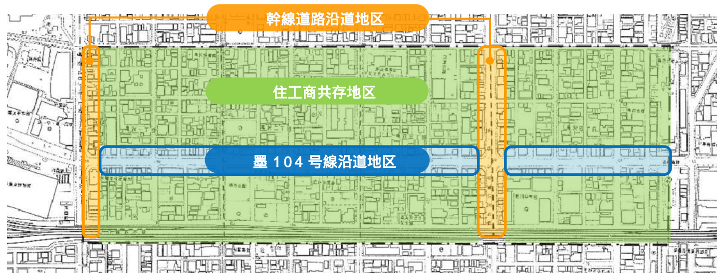
< 亀沢地区地区計画 地区区分 >