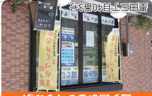
鐘ヶ淵まちづくりの駅 (一般財団法人) 墨田まちづくり公社 墨田三丁目40番3号