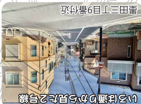
墨田三丁目9番付近