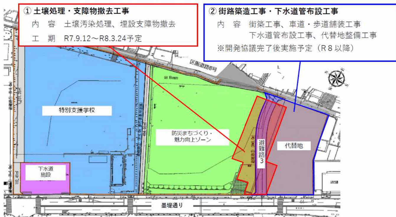
令和7年度工事实施箇所及び今後の工事予定

今後は、街路築造工事・下水道布設工事(下図青色)を予定しています。令和8年度以降に開発協議が完了次第、整備を進める予定です。