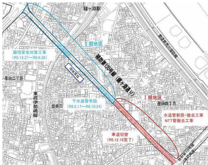
令和7年度工事实施箇所及び主な過年度工事

令和8年度は、更地化が完了した区間について、段階的に下水道布設工事を進める予定です。