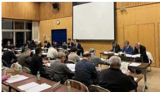
まちづくり懇談会当日の様子