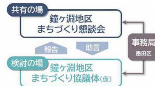
今後のまちづくりの進捗体制

今後は、まちづくり協議体(仮)で検討した結果がまちづくり懇談会に報告し、相互に連携しながら鐘ヶ淵地区のまちづくりを進めていきます。