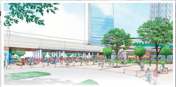
交通広場等のイメージ