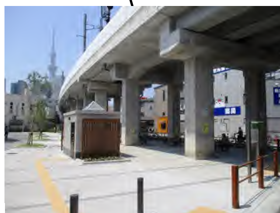
ひいらぎ広場 平成 30 年 4 月 開園 高架下利用面積 414.15 m 2