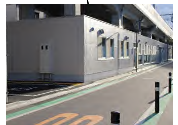
八広はなみずき高齢者支援総合センター 高齢者みまもり相談室 平成 31 年 2 月 開所 連続立体交差事業による高架下利用計画の範囲外