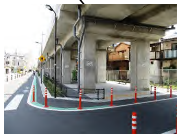
長浦いきいき広場 平成 30 年 4 月 開園 高架下利用面積 389.36 m 2