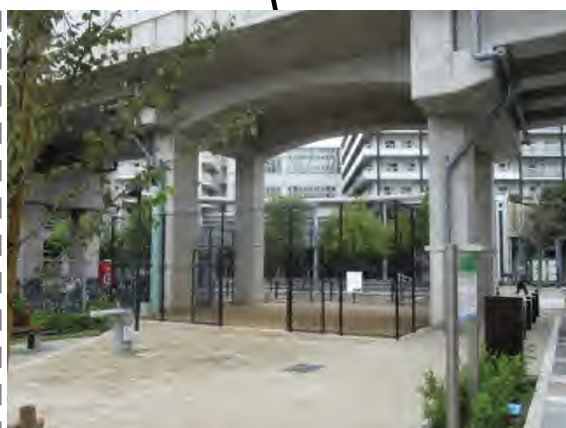
曳舟なごみ広場 平成 29 年 4 月 開園 高架下利用面積 90.33 m 2