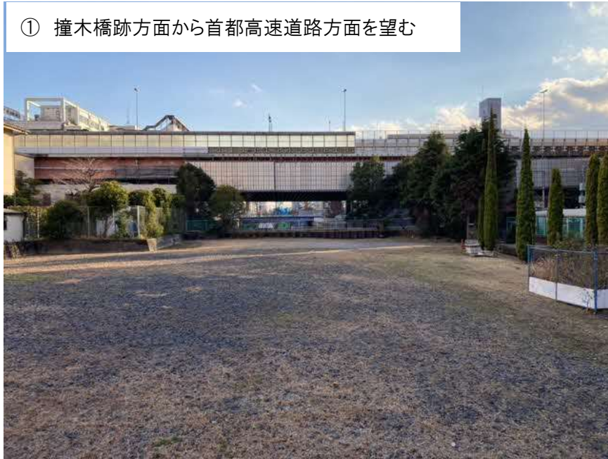
① 撞木橋跡方面から首都高速道路方面を望む