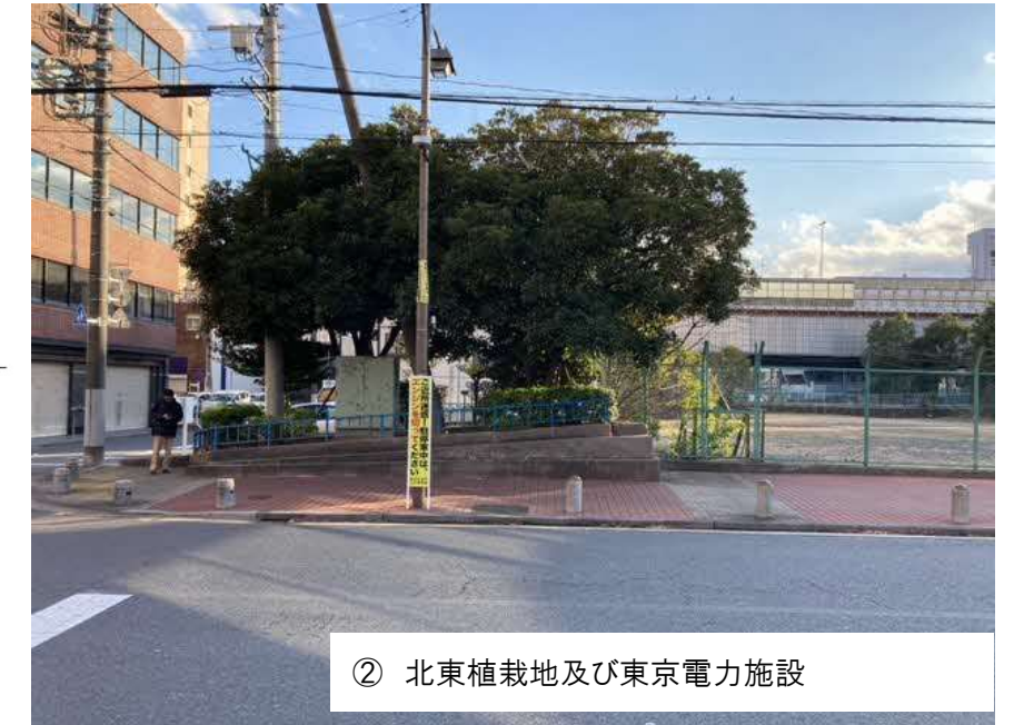
② 北東植栽地及び東京電力施設