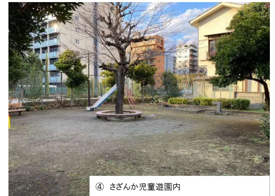
④ さざんか児童遊園内