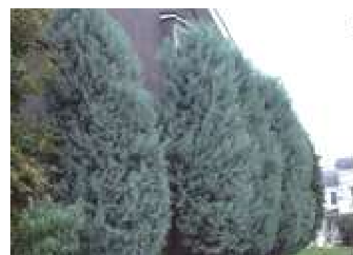
ブルーエンジェル