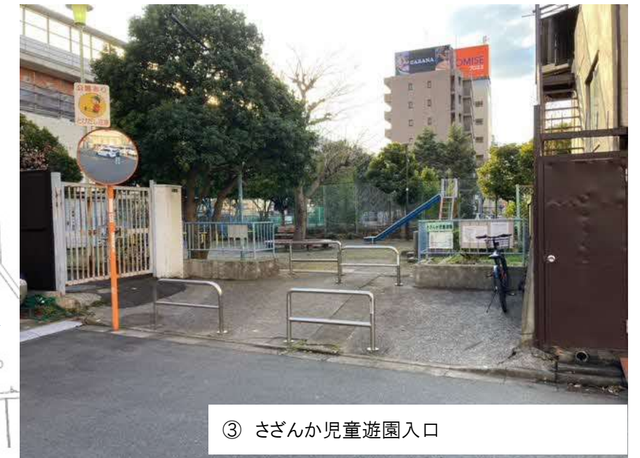
③ さざんか児童遊園入口