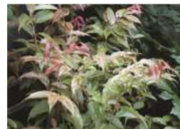
セイヨウイワナンテン