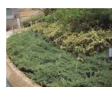
ブルーカーペット