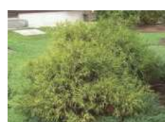
ゴールデンモップ