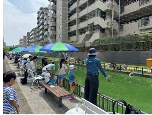
（イベント時の様子）