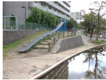
（ローラーすべり台）