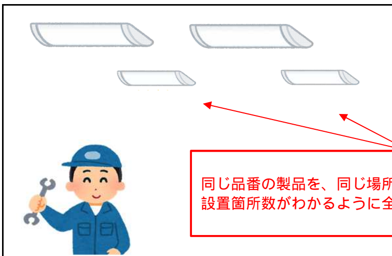
交換箇所 1 - 1 ~ 1 - 4 事務室 施工後

器具の部分を工事していることがわかるように写真を撮ってください。 器具の工事が伴わないものは補助金対象外です。