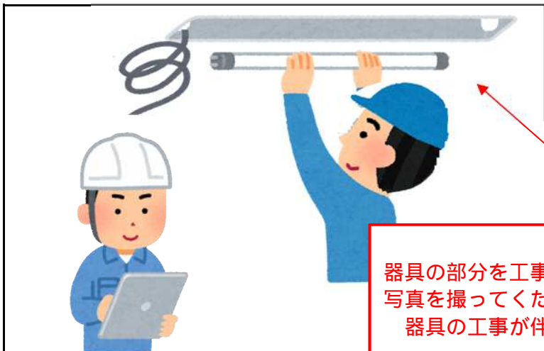
交換箇所 1 - 1 ~ 1 - 4 事務室 施工中

工事前の照明が、LED以外の照明器具だとわかるように、照明器具や品番等の写真を撮ってください。