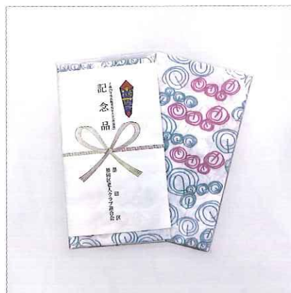
■ 墨田区老人クラブ連合