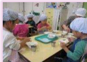
調理保育:出汁を学ぶ