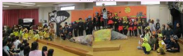
行事「おおきくなったねの会」3・4・5歳児合同 ライオンキング