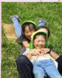
園庭・土手:泥んこ・流しそうめんごっこ・芝すべり