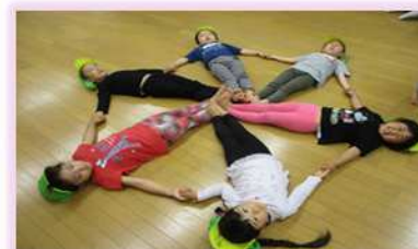
ホール:運動あそび