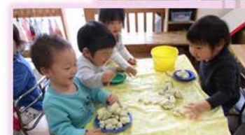
各クラス室内:粘土あそび