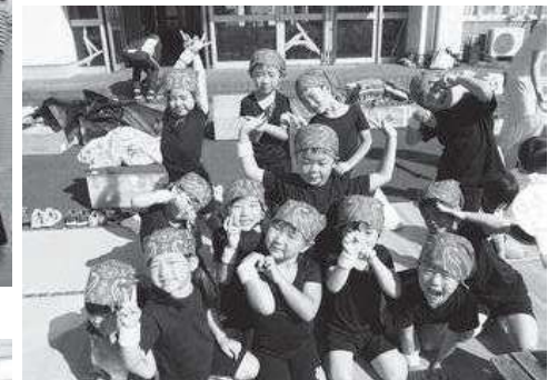
“みんなで 踊ったよ!!”