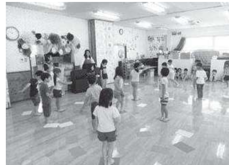
“何色の紙～!! どこ・どこ～!!” (3・4・5歳児)