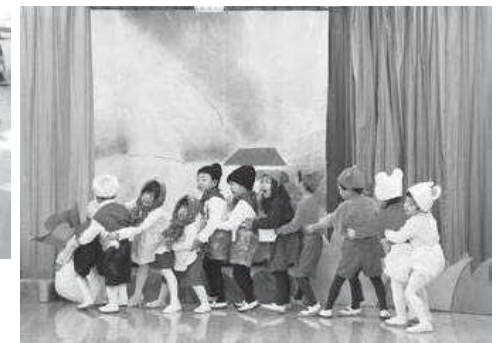
“大きなカブぬける! ウントコドッコイショ!!”