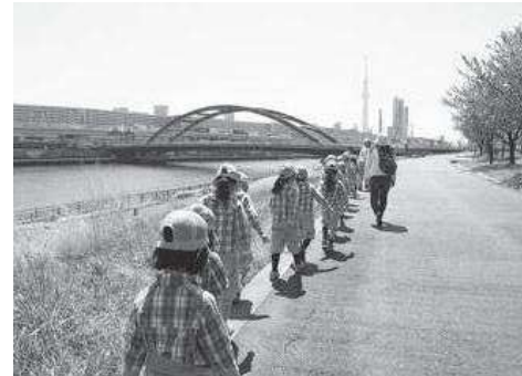
5歳児は毎日走るお散歩へ。今日はスカイツリーと桜です！

春・入園式・歩け歩け遠足・ほがらか祭 夏・七夕集会・プール開き・納涼大会・お泊り保育