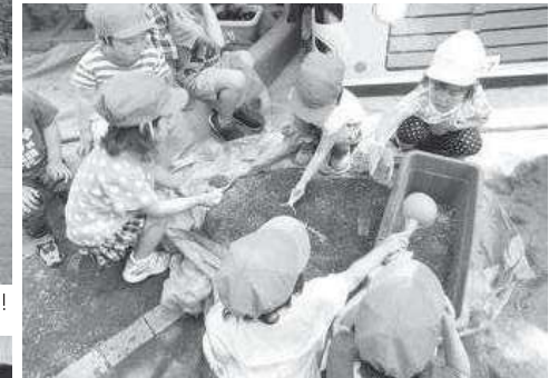
“セッセ、セッセ!! 何ができるかな?”

秋・うんどう会ごっこ・親子バス遠足(3・4・5歳児) 冬・作品展・クリスマス会・人形劇・豆まき集会 おたのしみ会・走るお散歩大会(5歳児・4歳児・卒園児・保護者と100名前後で走ります) お別れ会&進級式・卒園式