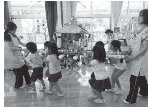
ワッショイ！ ワッショイ！ 手作りおみこしワッショイ！