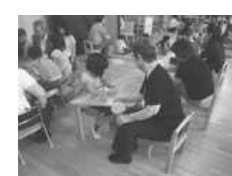
祖父母招待会 おばあちゃんからの一言 「私も光の園の卒園児です」