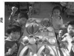
さんまパーティ 一人一匹 骨をとりながら「おいしーね」