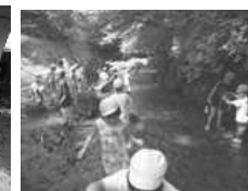
年長お泊まり保育 友だちや保育者と 自然の中で過ごします