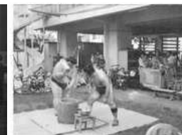
おすもうさんと一緒に もちつき大会