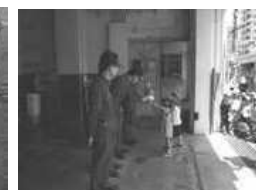
子どもの日花の日礼拝後 消防署訪問