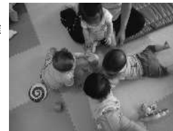
分園0歳児「あ・そ・び」