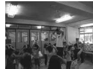
Let's sing together♪ 英語であそぼう