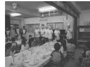
年長組 もうすぐ1年生!! お別れお食事会