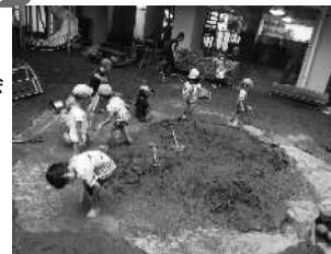
園庭での楽しいどろんこあそび