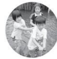
5歳児お泊り保育でのマスカミ