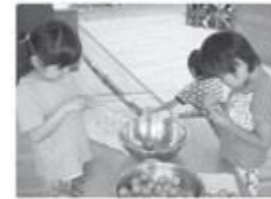
園庭で実った梅を使ってジュース作り