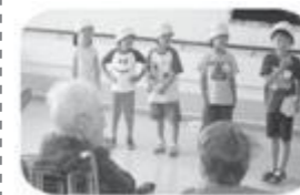
はなみずき特別養護老人ホームでの交流保育5歳児