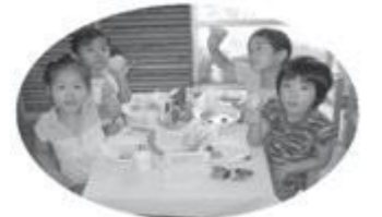
4歳児お泊り保育での朝食